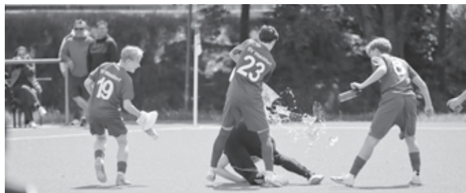
Die Meister-Dusche für den Trainer

Unsere Jungs spielten weiter schönen Kombinationsfußball und konnte die Führung kontinuierlich ausbauen.