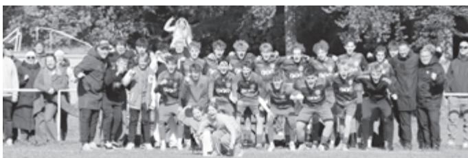
Herzlichen Glückwunsch, im Finale am 27.06 holt ihr euch den Pokal!

Damit haben unsere Jungs jetzt in Viertel- und Halbfinale den Zweit- und den Drittplatzierten der höherklassigen Regionstaffel ausgeschaltet, eine weitere Klasse Pokalsaison!