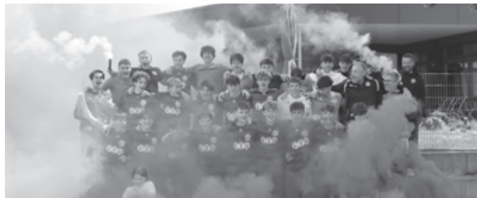
Es darf gefeiert werden!

Am Ende stand ein nie gefährdeter Sieg und nach dem Abpfiff konnte die Party steigen!