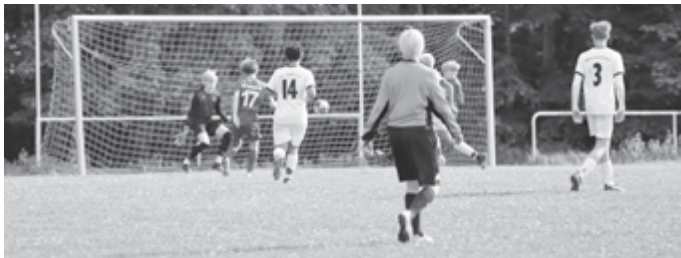
Hier schlägt der Ball zum 4:1 ein

Während die Gegner einige aussichtsreiche Konterchancen ungenutzt liesen konnten wir zweimal jeweils aus einem Gestochere im Strafraum zuschlagen.