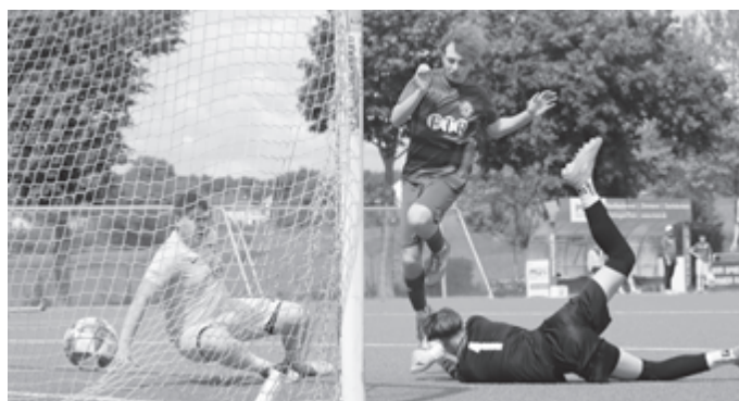
... aber hier ist der Ball dann wieder drin

Durch einen tollen Freistoß konnte Wendelsheim ausgleichen, das war aber gleichzeitig der Weckruf den unsere Jungs gebraucht hatten: noch vor der Pause konnten wir auf 3:1 davonziehen.