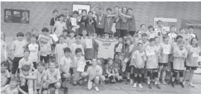
Alle teilnehmenden Mannschaften feierten den Württembergischen Meister und sich selbst.