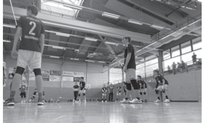
Die Volleyball-Jugend des TV Häslach startet in der kommenden Spielzeit erstmalig in der Bezirksklasse.

Interessenten – gerne auch für die Verstärkung des Trainer-teams - melden sich bitte per Mail an volleyball-jugend@tv-haeschlach.de .