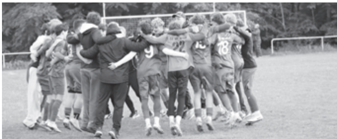
Die Mannschaft feiert ihren Sieg!

Mit der einzigen richtigen Chance des zweiten Durchgangs konnten unsere Kontrahenten den Anschlusstreffer erzielen. Nur wenige Minuten später wurde der alte Abstand aber wieder hergestellt und damit das 4:1 Endergebnis erzielt.