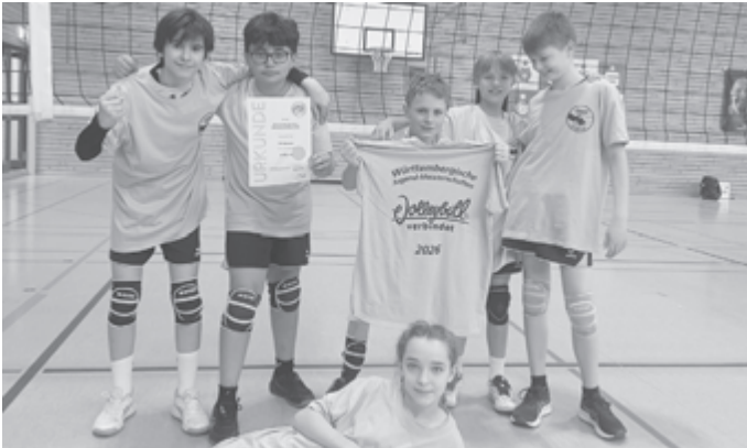
Glückliche U13 - eine Teilnahme an der WM ist immer etwas besonderes...

Biger Tag mit tollem Teamgeist endete mit einem "Happy End". Verdienter Württembergischer Meister U13m wurde der TV Rottenburg 1 vor dem VfB Friedrichshafen 1 und der TG Bad Waldsee 1.