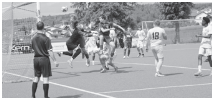
Der landet noch am Aluminium...

Danach gab es einen kleinen Bruch im Spiel, der Gegner wurde förmlich dazu eingeladen zurück ins Spiel zu finden.