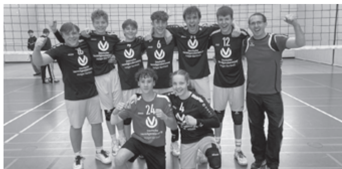
U18 beim Saisonabschluss beim Jugendpokal in Mutlangen.

Insgesamt war es ein intensiver Spieltag, bei dem die Ergebnisse zwar nicht zugunsten des TV Häslach ausfielen, die Mannschaft jedoch wichtige Erfahrungen sammeln konnte. Mit dieser Einstellung und dem gezeigten Zusammenhalt blickt das Team nach diesem letzten Pflichtspieltag der Saison 2025/26 motiviert auf die kommende Spielzeit.