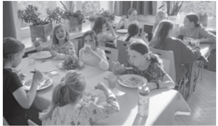
Am nächsten Morgen wurde gefrühstückt und danach wieder gebröckelt.

In der Jugendherberge angekommen wurden die Zimmer eingeteilt und wir durften uns einrichten. Nach einiger Zeit zum Spielen gab es Essen, danach stand eine Chorprobe auf dem Programm.