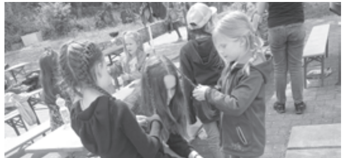
Und dann haben viele noch von einer Betreuerin (und auch die Betreuerin selbst) eine richtig schöne Frisur bekommen.