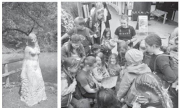
Dort hörten wir aus einem Buch die Geschichte über die schöne Lau. Wir konnten leider nur zur Hälfte um den Blautopf laufen, da die andere Hälfte gesperrt war. Also mussten wir wieder zurück. Wir haben noch ein leckeres Eis gegessen und dann die Stadtralley zu Ende gemacht.