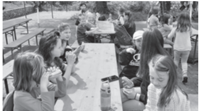
Am Nachmittag machten wir uns auf zu einem Ausflug in die Stadt und zu einer Stadtralley. Wir gingen gemeinsam zum Startpunkt, der Touristeninformation, und dann in Gruppen vorbei an vielen sehenswerten Häusern bis zum Blautopf.