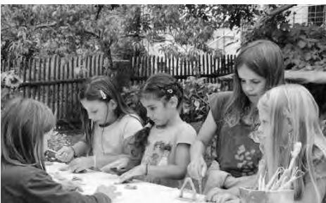
Bild- und Textrückblick unter Kirchliche Nachrichten