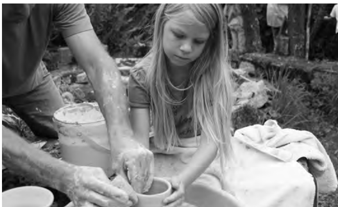
Der Töpfer steht helfend zur Seite. Am Schluss sorgt er für einen perfekten Rand.