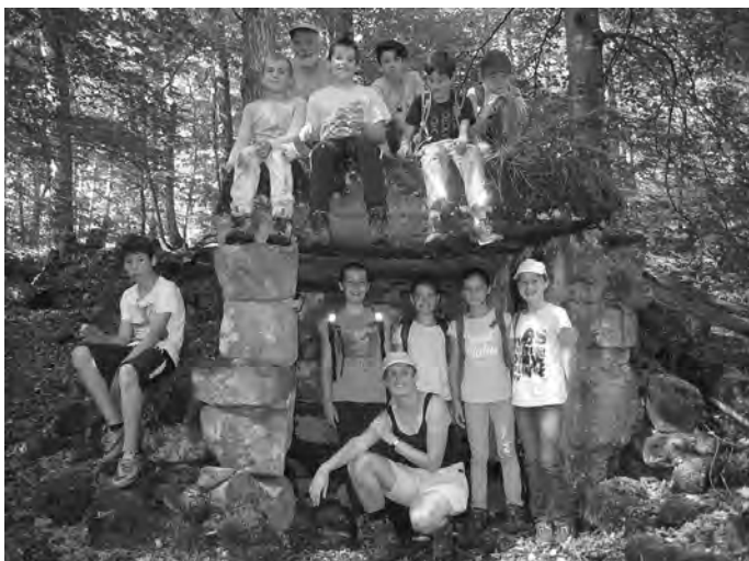
Gestärkt ging es wieder durch eine Schlucht hinunter ins Schaichtal, wo wir sogar eine Insel entdeckten.