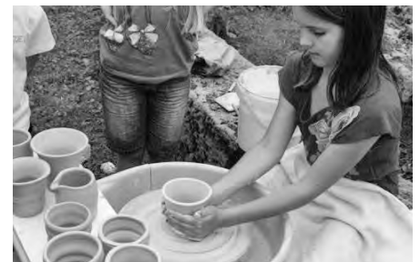
Kulturgüterverein - Töpfern Bild- und Textrückblick unter Vereinsnachrichten

SOMMERFERIENPROGRAMM 2017 auf der Gemeindehomepage unter „Aktuelles“ und in den Amtsblattausgaben 24, 25, 27 und 28; einige Plätze sind noch frei.