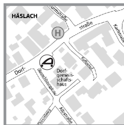
Häslach - Dorfstraße Opel Corsa, Tarif XS